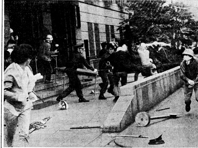
8月4日午後1時10分大学治安立法強行採決に抗議して中核派20名が文部省に突入した

八月三日臨時本会議で採決された大学治安法は、日本の教育史上、国家の前途に重大な影響を及ぼすものがある。この法案は、大学の自治を破壊し、学生を国家の道具にすることを目的としている。われわれは、この法案を徹頭徹尾反対し、この法案の成立を許さず、この法案の採決を断固として拒否する。われわれは、この法案の採決を断固として拒否し、この法案の採決を断固として拒否する。