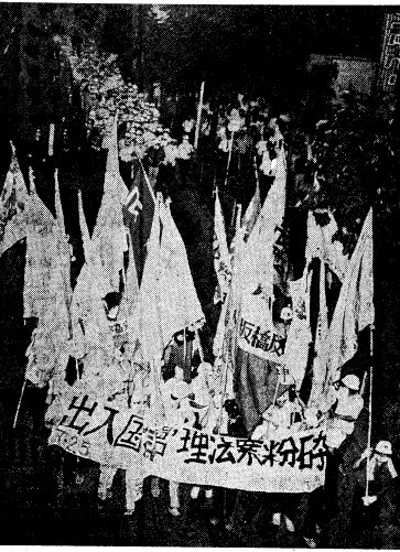
七月二十五日、国会へ向っての入国法第三波闘争がけちとられた(東京)