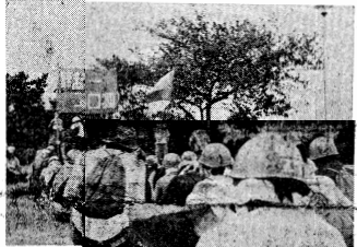
横須賀臨海公園での決起集会

十月十四日、横須賀臨海公園に、唯一決起。労働者は、ミッドウエー母港化阻止を遂げるべく、激しい闘争を展開した。労働者は、ミッドウエー母港化阻止を遂げるべく、激しい闘争を展開した。