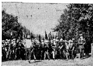
カクマル粉砕—決起

十月十日、横須賀臨海公園に、日本共産党の呼びかけで、約一万人の労働者が決起し、カクマルの登場を粉碎す。この日、横須賀市は、労働者の怒りの嵐に包まれた。臨海公園に集った労働者は、カクマルの登場を阻止すべく、激しい闘争を展開した。労働者は、カクマルの登場を阻止すべく、激しい闘争を展開した。労働者は、カクマルの登場を阻止すべく、激しい闘争を展開した。