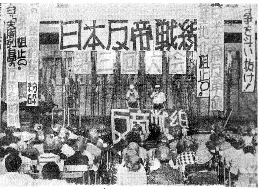
日本反帝戦線第三回大会は九州県地に全国300名の戦士をむかえちかちとられた

諸派の脱落と逃亡を踏越え、沖共闘を革命的に牽引せよ。我々旗超プロ独派の旗軍部隊は、諸派の脱落と逃亡を踏越え、沖共闘を革命的に牽引せよ。