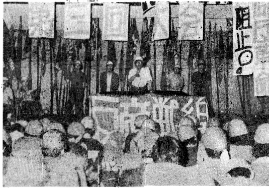
新たな執行部の決意表明を要し、反帝戦線は組織の下更なる進軍を要する一した