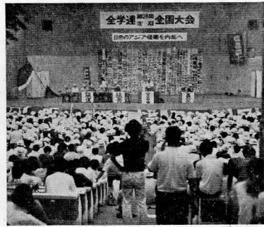
7・19 日比谷野音開会総会

全学連(中核系)第28回定期全国大会の開会総会が、19日(土)日比谷野音会場で開かれた。開会式には、全学連(中核系)の各支部代表者約5,000名が参加した。開会式は、まず、開会宣言、次に、各支部代表者の演説が行われた。開会宣言は、全学連(中核系)の代表者によるもので、学生運動の現状と今後の展望について述べられた。各支部代表者の演説は、各支部の活動報告と今後の活動方針について述べられた。開会式は、午後5時に閉幕した。