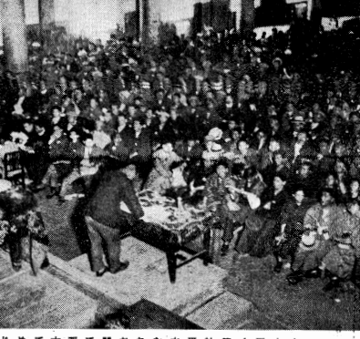
大会4日水本平社水大開かた

労働者の立場から見て、労働者の利益を擁護し、労働者の権利を伸張することを目的とする。これは、労働者の立場から見て、労働者の利益を擁護し、労働者の権利を伸張することを目的とする。これは、労働者の立場から見て、労働者の利益を擁護し、労働者の権利を伸張することを目的とする。