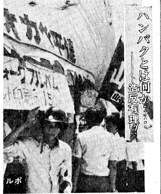
ハンパクとは何か 逆反有理